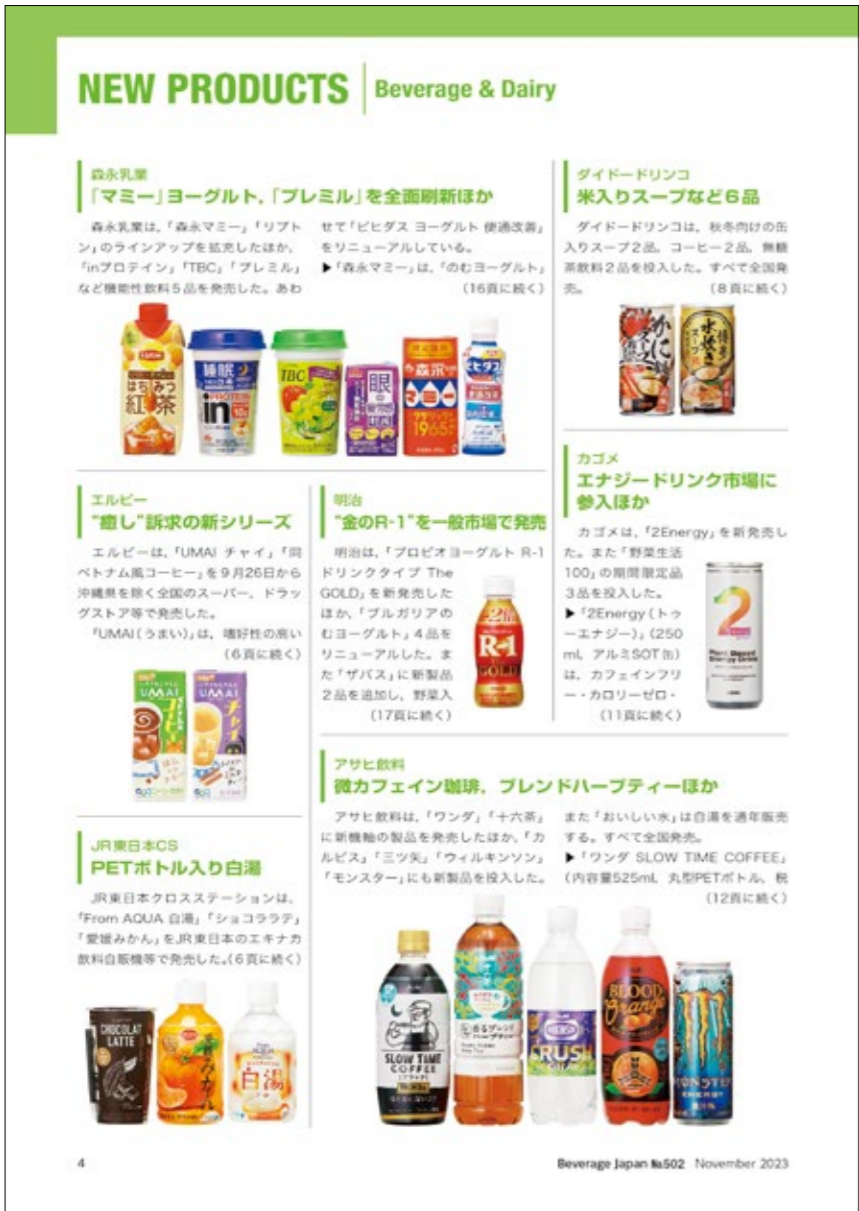
Beverage Japan No502 November 2023

製品の容器形状や容量などのバリエーション、価格、販売地域といった基本情報から開発背景、新容器についての解説、原料、栄養成分表記なども掲載。